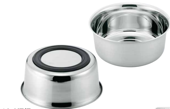
18-8湯桶 18-8 Washing bowl(hot water bowl)