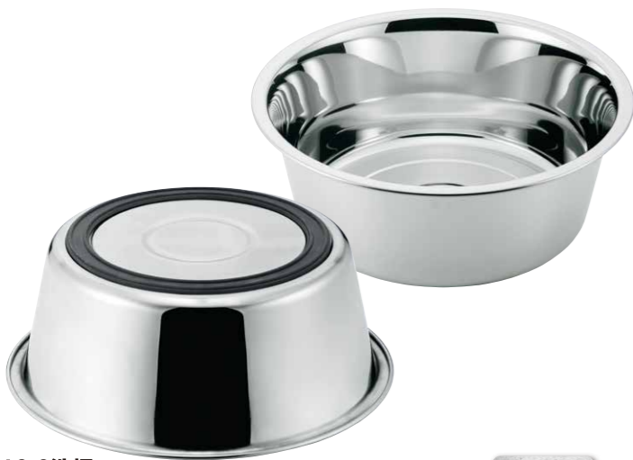
18-8洗桶 18-8 Washing bowl