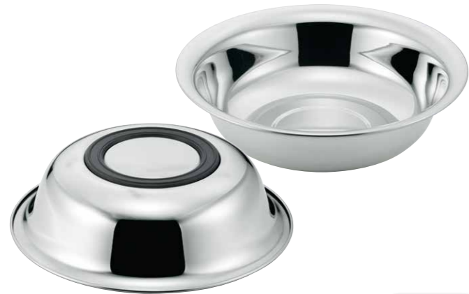
18-8洗面器 18-8 Wash basin