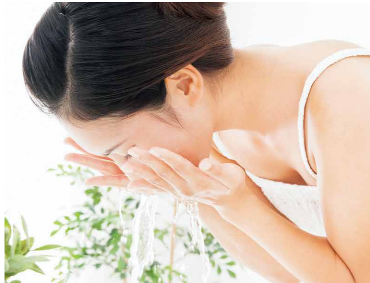
18-8 Stainless Steel